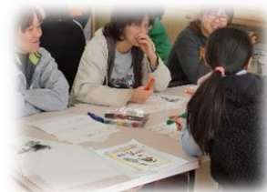
お父さんお母さん講座 ～子どもの 元気を育てよう～