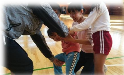
ふれあいあそび ～おやこで仲良く～

定員 30組 定員を超えた場合のみ 連絡をいたします。 受付完了の 連絡はいたしません。