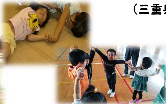
からだを使ってあそぼう ～おもいつきり楽しもう～