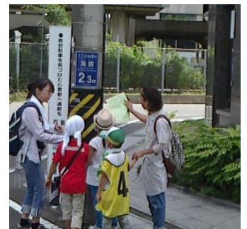
チェックポイントで海拔を確認する参加者